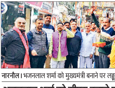
नारनौल। भजनलाल शर्मा को मुख्यमंत्री बनने पर लड्डू बांटे हुए।