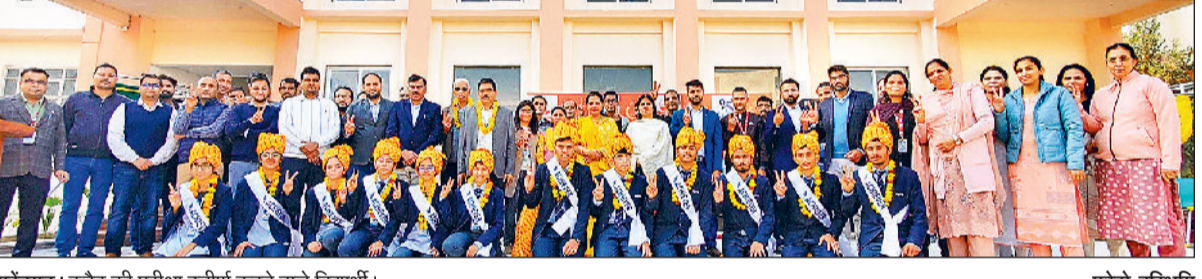
महेन्द्रगढ़। वलैट की परीक्षा उत्तीर्ण करने वाले विद्यार्थी।