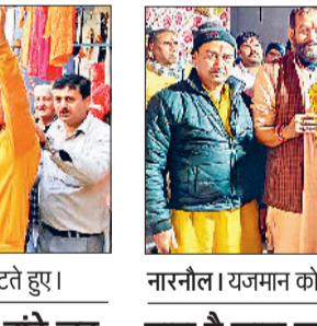
नारनौल। यजमान को स्मृति विह्न भरते हुए।