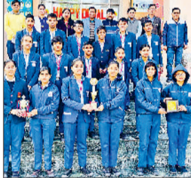
महेन्द्रगढ़। विजेता विद्यार्थियों को सम्मानित करते हुए।

यदुवंशी शिक्षा निकेतन के विद्यार्थियों ने अंतरराष्ट्रीय गीता जयंती महोत्सव के उपलक्ष्य में शिक्षा विभाग की ओर से आयोजित खंड स्तरीय विभिन्न प्रतियोगिता में प्रथम स्थान प्राप्त किया है। ये सभी प्रतियोगिता सोमवार को कन्या विद्यालय में प्रातः 10 बजे आयोजित की गई, जिससे मुख्यतः कक्षा छठी से आठवीं तथा नौवीं से 12वीं दो वर्ग रखे गए। बच्चों ने श्लोकोच्चारण, संवाद, प्रश्नोत्तरी, भाषण, निबंध लेखन तथा पेंटिंग में