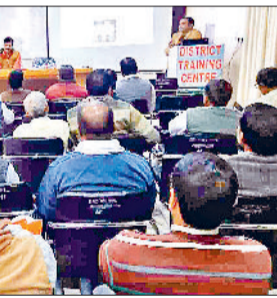
महेन्द्रगढ़। प्रशिक्षण लेते शिक्षक।