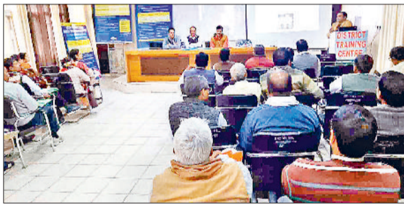
महेन्द्रगढ़। प्रशिक्षण लेते शिक्षक।