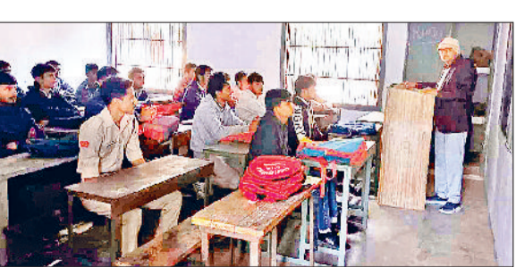
महेन्द्रगढ़। विद्यार्थियों को संबोधित करते हुए।