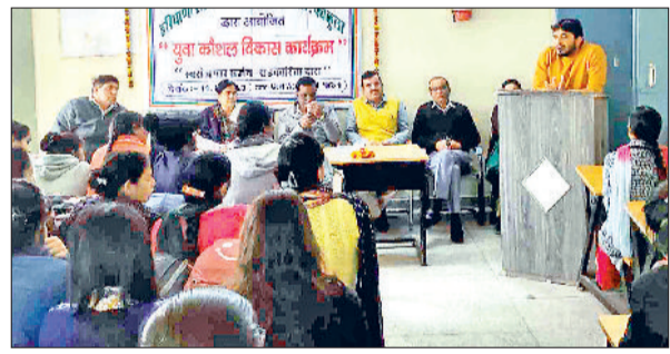
महेन्द्रगढ़। छात्राओं को संबोधित करते हुए।